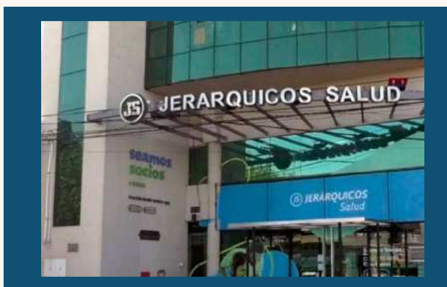
Sede Central en la ciudad de Santa Fe